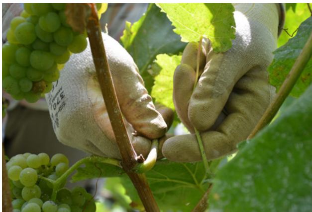
L'esposizione durante il contatto con la coltura trattata è spesso sottovalutata.