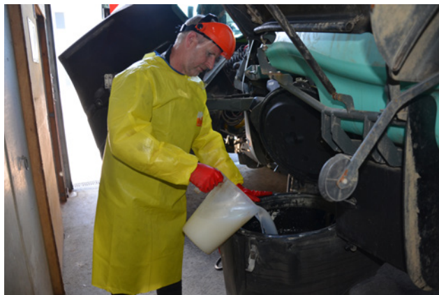
I DPI sono l'ultima misura di protezione, preceduta da una serie di altre misure precauzionali.

Il principio STOP si applica molto bene alla riduzione del rischio per la salute durante l'utilizzo professionale di PF. Questo principio è presentato in dettaglio nella documentazione del Toolkit per ogni fase di utilizzo dei PF.